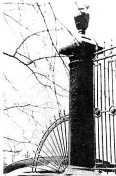
Фотоэскиз "Иней" К. Лосева, ведущего конструктора НИИ

Ответы на кроссворд: снеток, конспект, зачетная, являющая, шпана, шар, год, красная, сессия, мороз, какже, нежесткая, фразда, тираж